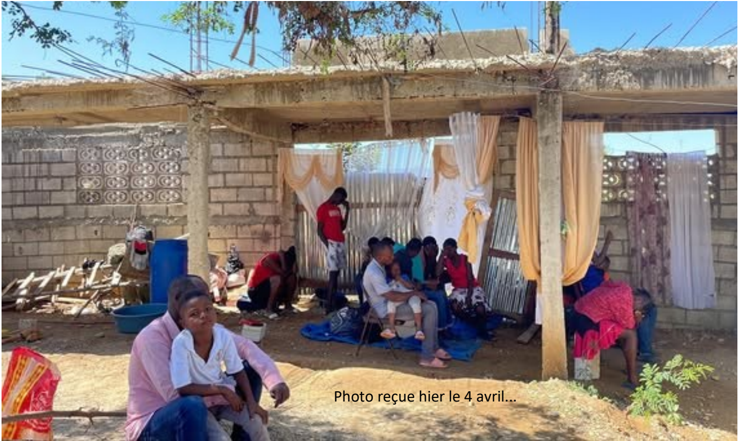
Photo reçue hier le 4 avril...

Voici l'endroit où elles se trouvent présentement avec comme tout 'confort' les vêtements qu'ils ont sur le dos et quelques chaises mises à leur disposition !