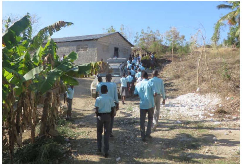
Les camarades de Borame se rendent à son église pour ses funérailles.