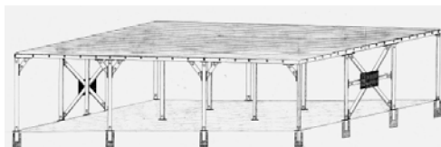
Abri : 36 pi. x 36 pi. très solide pouvant servir à de multiples usages !