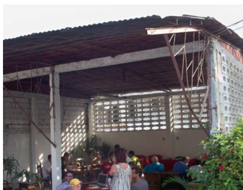
Aperçu de la salle à manger du Wall's Guest House aménagée dans un hangar depuis le tremblement de terre !